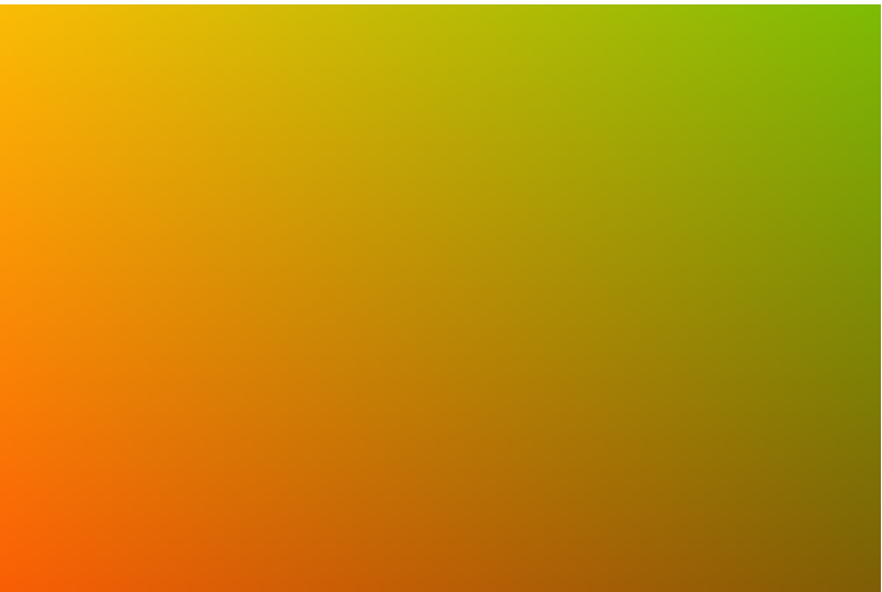
Figure 3: Sample image for multimodal RAG ingestion