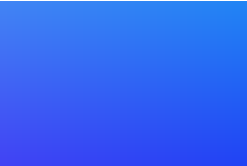
Figure 6: Sample image for multimodal RAG ingestion