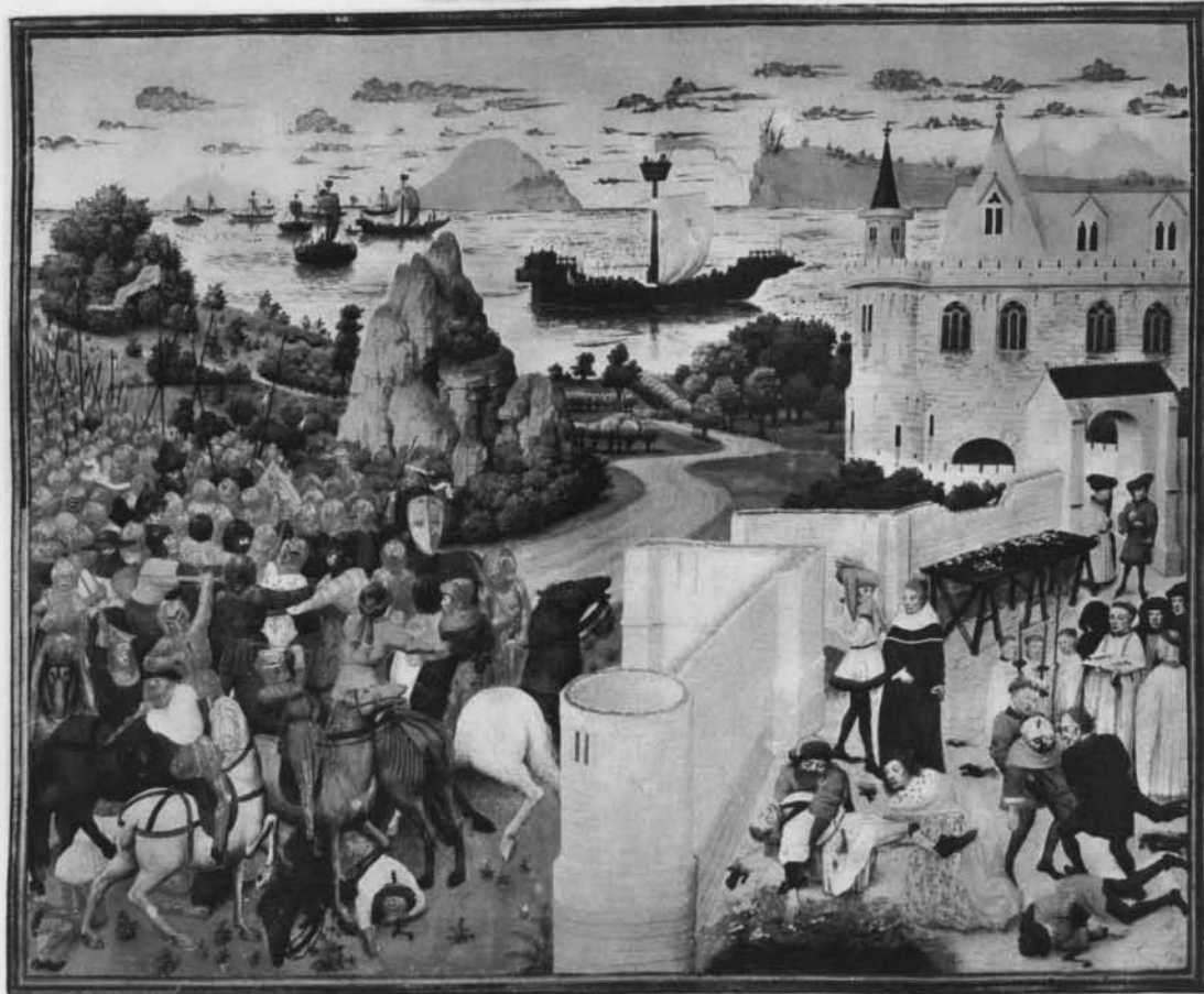
SAINT LOUIS A MANSOURAH GRANDE MINIATURE DU MANUSCRIT DES "GRANDES CHRONIQUES DE SAINT DENYS" (Bibliothèque Impériale, St Pétersbourg.)