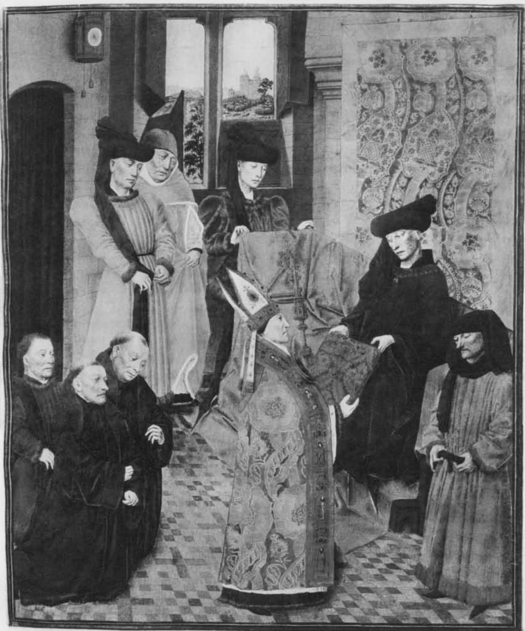
G. FILLASTRE, ABBÉ DE SAINT BERTIN, OFFRE LE MANUSCRIT DES "CHRONIQUES" A PHILIPPE LE BON FRONTISPICE DU MANUSCRIT DES "GRANDES CHRONIQUES DE SAINT DENYS"