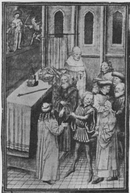
PÉNITENCE DE LOUIS LE DÉBONNAIRE DEVANT L'AUTEL DE SAINT SÉBASTIEN A COMPIÈGNE 2 MINIATURE DES « GRANDES CHRONIQUES DE SAINT-DENYS » (Bibliothèque impériale, Saint-Petersbourg.)