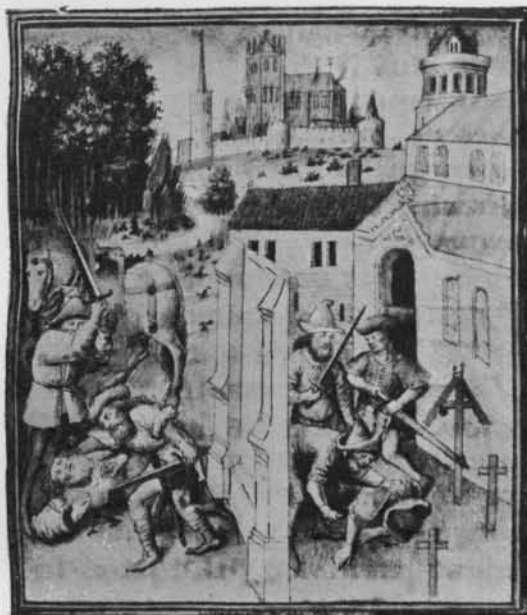
ASSASSINATS DE CHILPÉRIC ET D'ÉBÉRULPHE 1 MINIATURE DES « GRANDES CHRONIQUES DE SAINT-DENYS » (Bibliothèque impériale, Saint-Petersbourg.)

Il est intéressant de comparer ce frontispice à ceux des Histoires de Hainaut , à Bruxelles, et du Gérard de Roussillon , à Vienne 3 . Dans