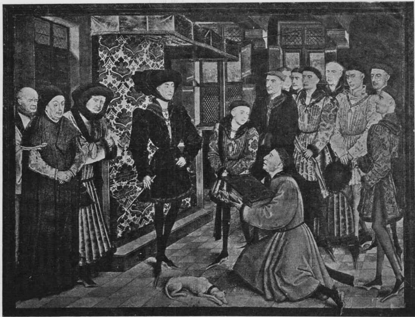
FRONTISPICE DES « HISTOIRES DE HAINAUT »