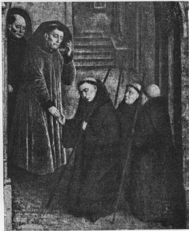
SAINT OMER RECEVANT SAINT BERTIN (FRAGMENT)

L'ouvrage que Fillastre fit copier est bien connu : c'est la compilation française dite Grandes Chroniques de Saint-Denys , dont il existe un très grand nombre de manuscrits. L'un d'eux, à la Biblio-