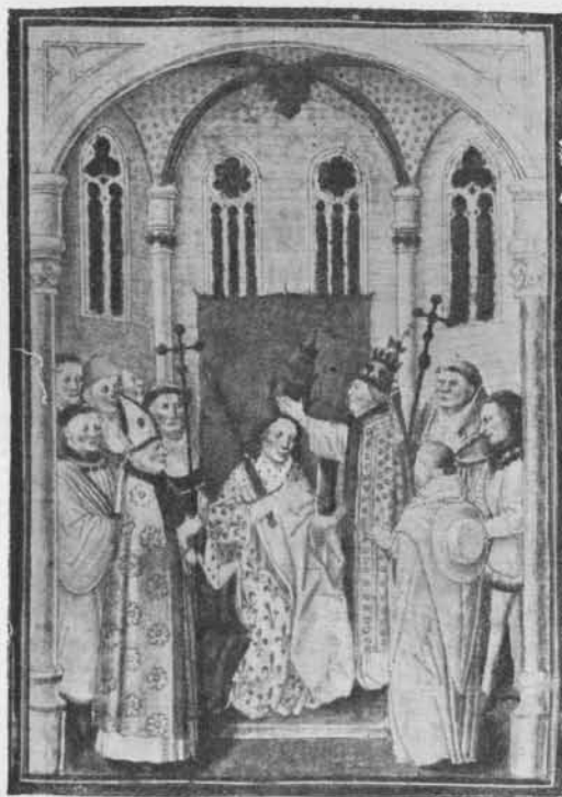
COURONNEMENT DE CHARLES LE CHAUVÉ MINIATURE DES « GRANDES CHRONIQUES DE SAINT-DENYS » (Bibliothèque impériale, Saint-Pétersbourg.)

à Rogier n'est cependant pas certaine. En haut de la miniature qui représente la bataille de Roncevaux figure l'écartèlement de Ganelon très analogue à celui de Saint-Hippolyte à Bruges 1 , que l'on a de bonnes raisons pour donner à Bouts. La couleur chaude des miniatures fait également songer à ce maître de Harlem 2 . Les analogies